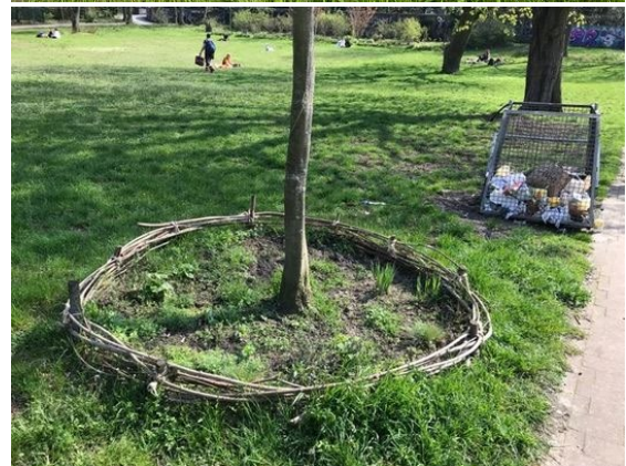
Fine grønne detaljer rundt omkring i byen.