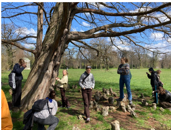
Vi brugte lang tid sammen med dette skønne træ, som vi med hjælp fra sociale medier og vores medstuderende derhjemme fandt frem til formentlig er en sumpcypres ( taxodium distichum ).