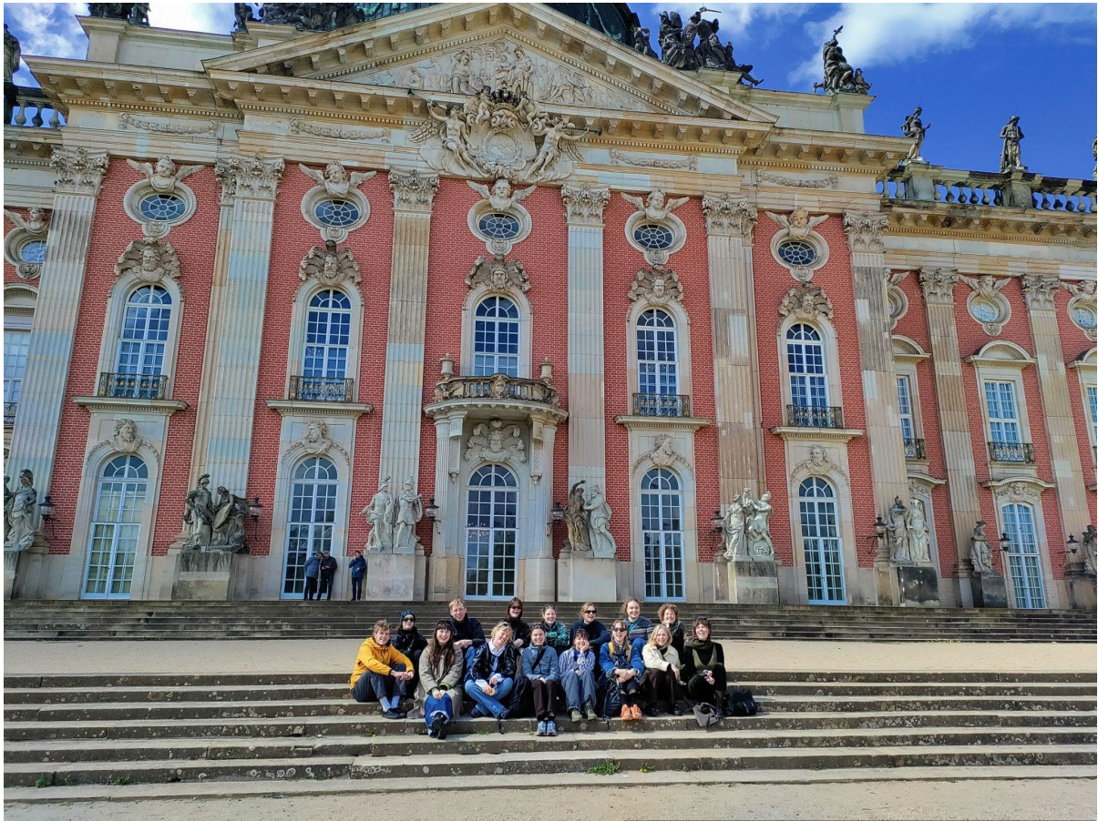
Gruppenbillede foran Neues Palais