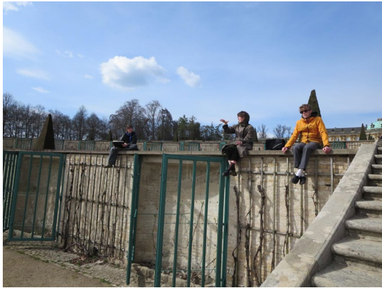
Frokost fik vi i Potsdam Universitets kantine.